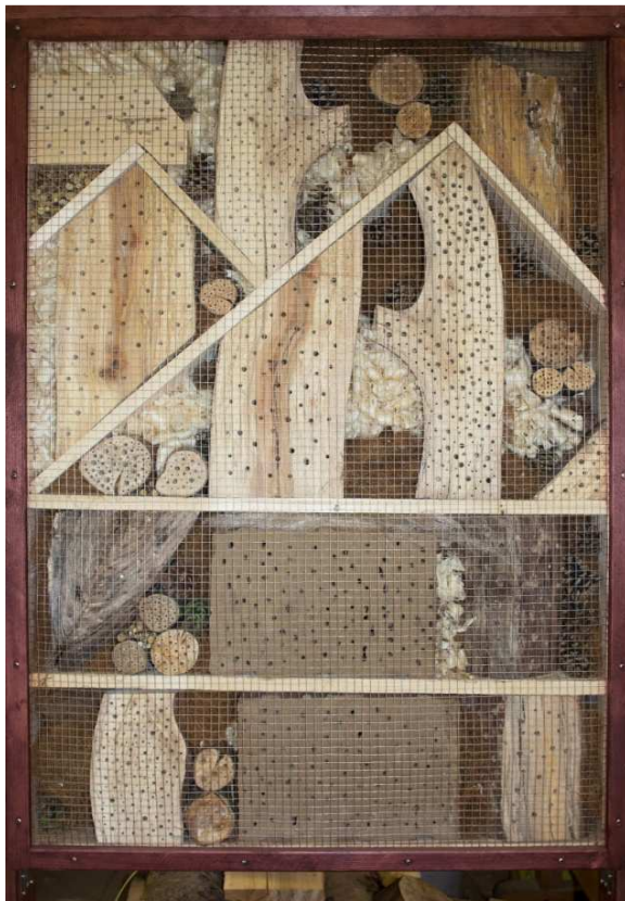
Abb. 5: Eine aus verschiedenen Materialien zusammen gestellte Wildbienen-Nisthilfe. Der Kaninchendraht dient als Vogelschutz.

Abgestorbene Äste oder Stämme sind für sehr viele Tiere ein wichtiger Lebensraumbestandteil. So gibt es bestimmte Wildbienen, wie die Schwarzblaue Holzbiene ( Xylocopa violacea ), die ihre Brutröhren im Totholz anlegen. Auch diese Arten können relativ einfach unterstützt werden, wenn größere morsche Laubholzstücke, z. B. von Pappel, Apfel oder Weide, einzeln aufgestellt oder gestapelt werden.