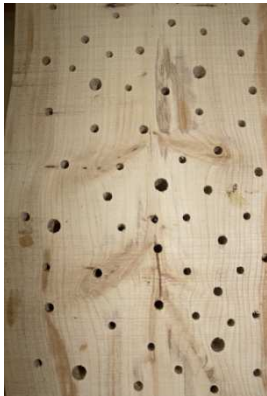
Abb. 2: Ausschnitt eines Holzblocks mit Bohrungen ins Längsholz.