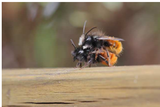
Abb. 1: Die Gehörnte Mauerbiene ( Osmia cornuta ), hier ein Pärchen vor der Kopula (♂ oben), nutzt sehr häufig Nisthilfen.

Die folgende Anleitung soll zeigen, was beim Bau einer Wildbienen-Nisthilfe beachtet werden sollte, damit sie auch einen Nutzen für diese interessanten und ökologisch bedeutsamen Tiere hat.